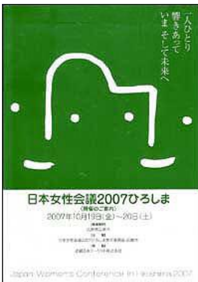
開催のご案内 (募集要項)

参加申し込みは6月1日(金)から7月31日(火)まで。ファクスかホームページでお願いします。詳しくはホームページ( http://www.hiroshima2007.info/ )をご覧ください。皆様の参加をお待ちしています。